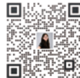
华南区销售 (T: 187 0843 6952)