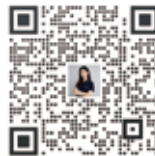
华东/华北区销售 (T: 176 2190 9870)