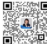
华南区销售 (T: 136 0001 6493)