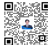
华东区销售 (T: 176 2190 9870)